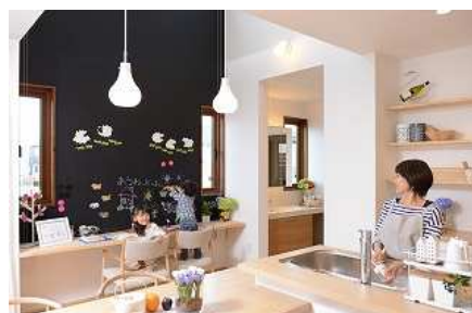
コミュニケーションキッチン・ファミリーウォール