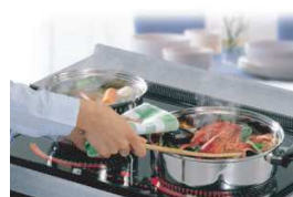
オール電化セット