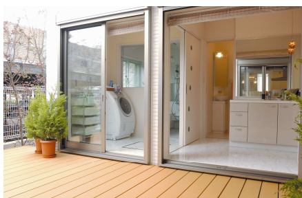
ランドリーテラス