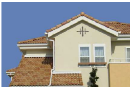
外壁塗り壁セット

大賀建設／アルネットホーム（以下弊社）は2013年1月2日（水）より2013年3月31日（日）までにご契約されたお客様を対象に、お得な家づくりができる「得々プレミアムセレクション」キャンペーンを展開します。「外壁塗り壁」「自然素材」「オール電化」「省エネeco」「人気設備」のプレミアムなセットからお客様のお好きなものをセレクトすることができます。